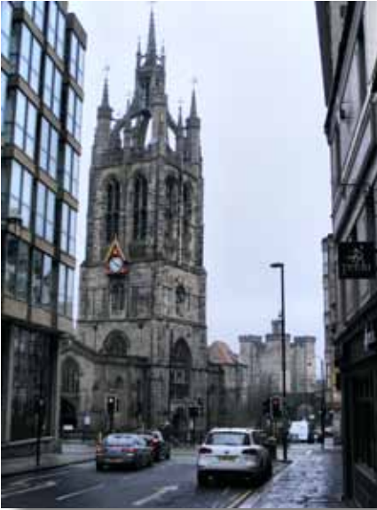
St. Nicholas Kathedrale Englands nördlichste Kathedrale

Bereits hinter dem Eingang wartete ein Priester, begrüßt sehr freundlich mich als Besucher, fragte sofort, welche Sprache bzw. welcher Herkunft ich sei, um mir natürlich sofort den richtig sprachlichen Flyer in die Hand zu drücken, verbunden mit einigen Hinweisen auf Sehenswürdigkeiten, ich aber auch wunschgemäß selbstverständlich den englischen Flyer mitnehmen könnte. Das Besondere für mich war sofort, dass in einer Nische so etwas wie eine Spielecke eingerichtet war, in der Nähe der liegenden Statue eines unbekanntenen normannischen Ritters. Im rechten Teil des Kirchenschiffs gab es ein Büro mit geöffneter Tür