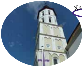
Xanten - Mörmter