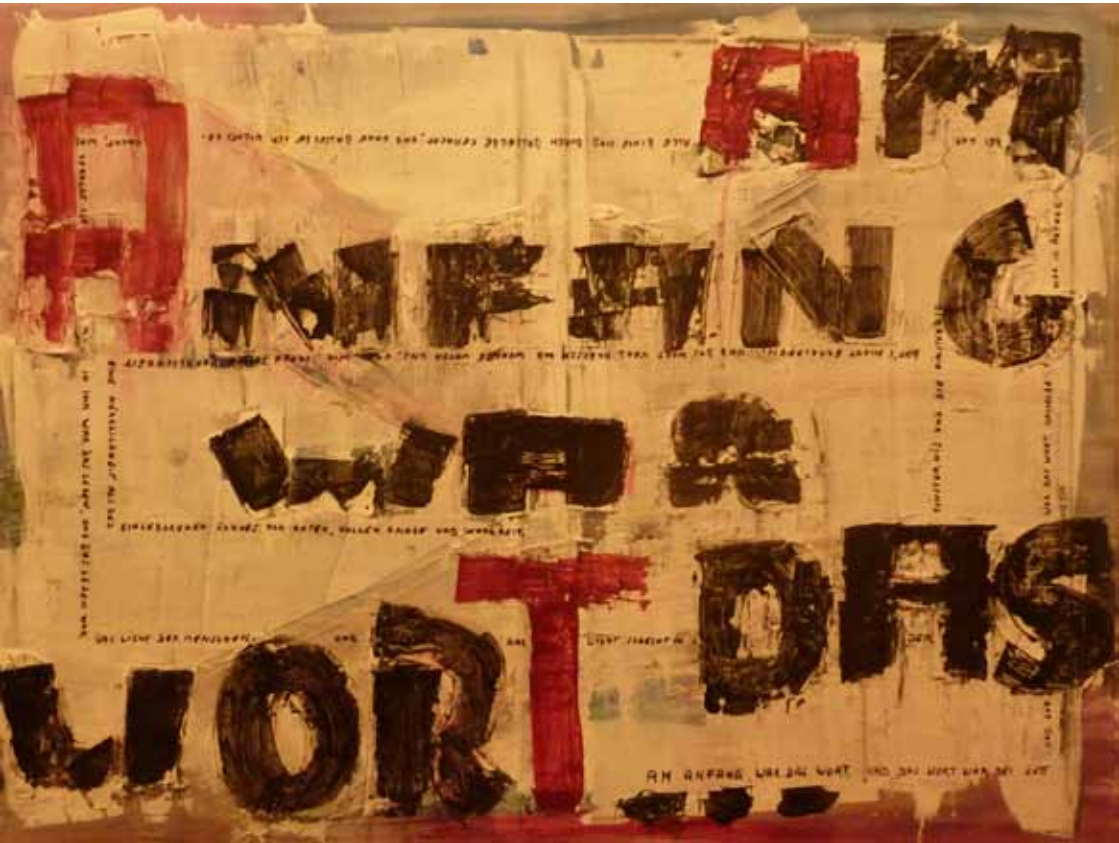
Bild und Bibel Das Themenjahr 2015 auf dem Weg zum Reformationsjubiläum