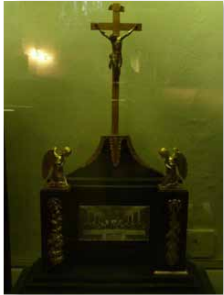
Der Altaraufsatz steht heute in einer Schauvitirine in der Kirche.

tisch wurde zu einem lutherischen Altar auf drei Stufen durch einen Aufsatz mit Engeln, einem Kreuz mit Kruzifix und einer Abbildung des letzten Abendmahls, dargestellt von Leonardo da Vinci.