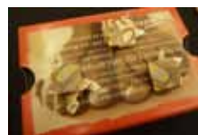
Spenddose im Schuhhaus Scholten.