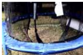
Das zerstörte Trampolin entsetzt Kinder und Mitarbeiterinnen

„Wer hat das gemacht?“ „Waren das Räuber oder Einbrecher?“ „Warum haben die das gemacht?“ Das waren die Fragen der Kinder an einem Montagmorgen im September.