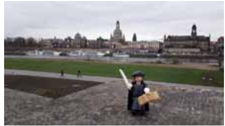
Eine der ersten Einsendungen

Ach ja, eine Preisverleihung soll es zum Jahresende 2017 auch geben. Lassen Sie sich überraschen!