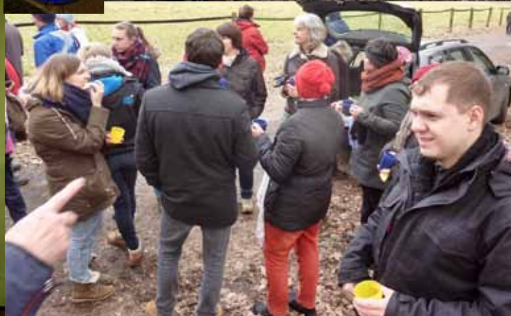
Eindrücke vom Danke-Tag 2017