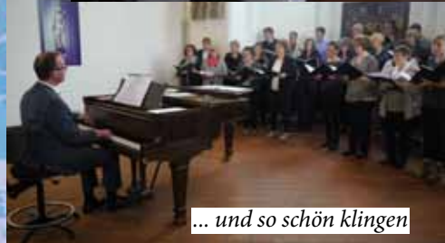
... und so schön klingen