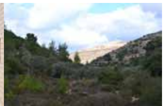
Hirtenfelder in der Umgebung