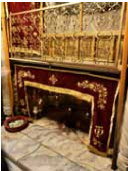
In der Geburtskirche.

Er wünscht allen ein frohes und gesegnetes Weihnachtsfest.