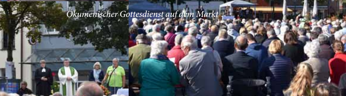
Ökumenischer Gottesdienst auf dem Markt

Eindrücke vom Ökumenischen Gemeindefest 10. September 2017 in Xanten