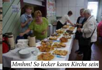
Mhm! So lecker kann Kirche sein