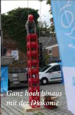
Ganz hoch hinaus mit der Diakonie