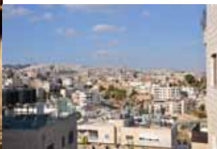
Beit Sahour - hier lebe ich.